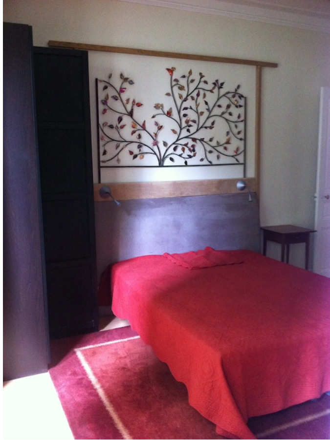
< Suite parentale